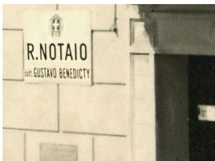
Tabla notarske pisarne v Sežani (1938)

Njegov oče Gustavo Benedicty je s prevodom Freudovega dela sodeloval pri prenosu psihoanalitične misli v italijanski prostor, sin pa je deloval v mednarodnem univerzitetnem okolju, kjer je pustil prepoznaven pedagoški pečat. Njuna doslej nikjer navedena povezanost s Sežano nas simbolno umešča v širši kontekst intelektualne dediščine 20. stoletja.