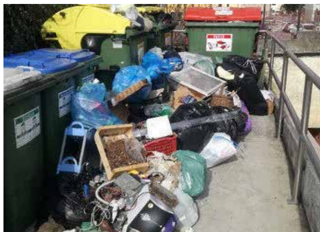
Komunalno stanovanjsko podjetje, d. d., Sežana