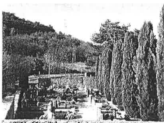
Del starega pokopališča Sežana

Glede na obliko pokopa je bilo največ žarnih pokopov, nekoliko več raztrosov v primerjavi s prejšnjim letom ter še vedno se beleži padec pri klasični obliki pogreba.