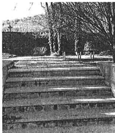
Poti na pokopališču Sežana